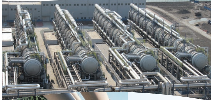
4 x MED 25,000 装置，中国天津

IDE 由以色列最大的两个工业集团联合拥有：在化肥和精细化工品公司中居于世界领导地位的以色列化工集团（50% 股份）和一流的以色列跨国能源和基础设施 Delek 集团（50% 股份）。