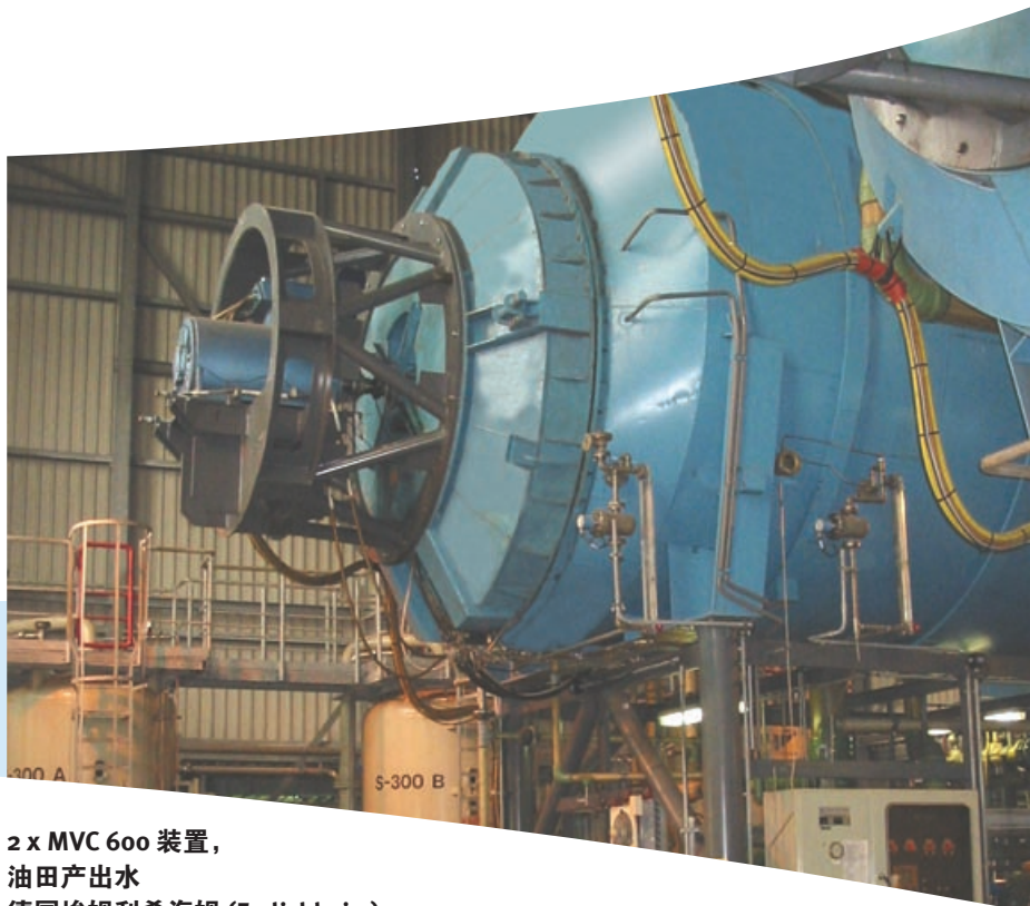
2 x MVC 600 装置， 油田产出水 德国埃姆利希海姆 (Emlichheim) 温特歇尔 (Wintershall)