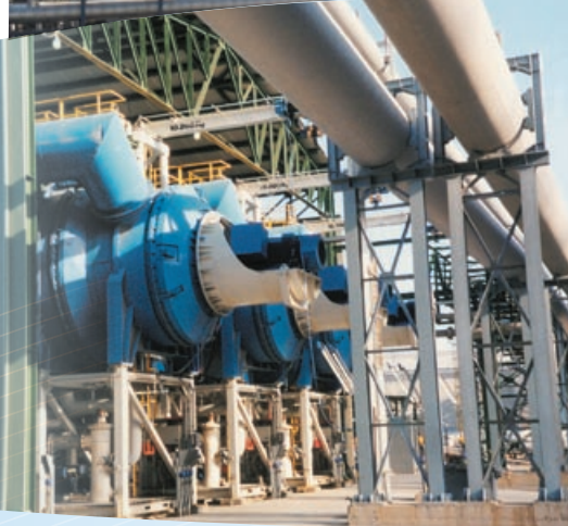
6 x MVC 2,880 装置， 意大利撒丁岛撒卢克斯 (Sarlux)