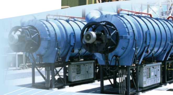
2 x MVC 1,250 装置，美属维京群岛， 圣克罗伊岛，Vialco