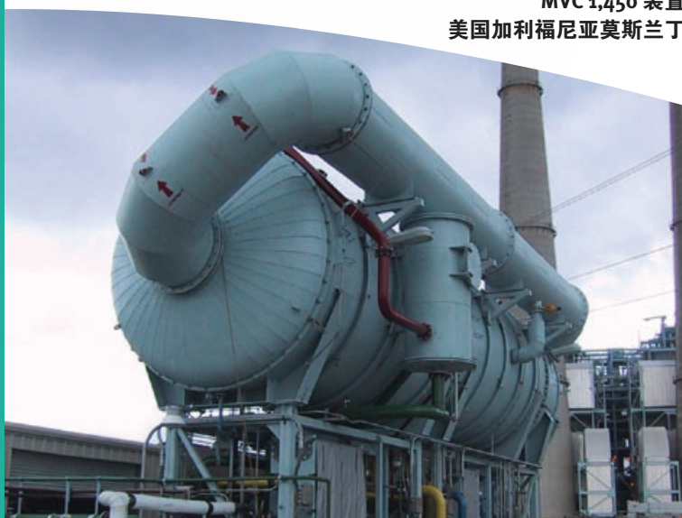
MVC 1,450 装置 美国加利福尼亚莫斯兰丁