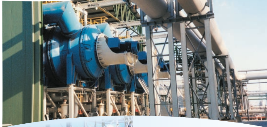
6 x MVC 2,880 装置，撒卢克斯 (Sarlux) 意大利撒丁岛

IDE 由以色列最大的两个工业集团联合拥有：在化肥和精细化工品公司中居于世界领先地位的以色列化工集团（50% 股份）和一流的以色列跨国能源和基础设施 Delek 集团（50% 股份）。